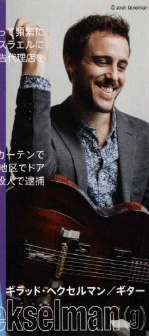
ギラッド・ヘクセルマン / ギター