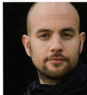
シャイ・マエストロ / ピアノ